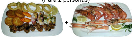
Bandeja de Fritura