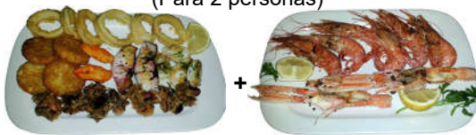
Bandeja de Fritura